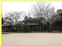
藤塚第3公園(徒歩約2分)