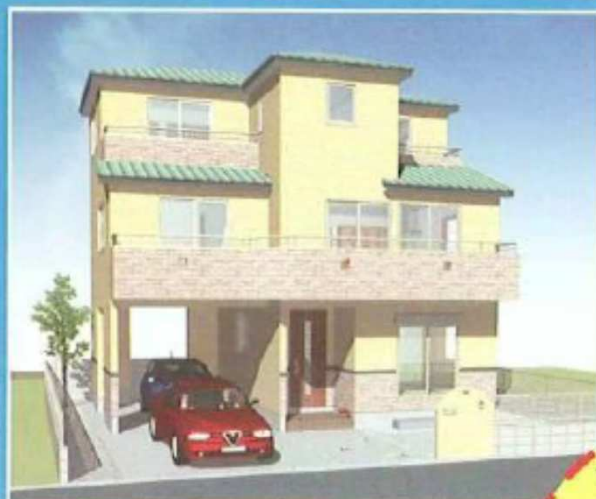
※予想パースにつき実際と異なる場合があります。