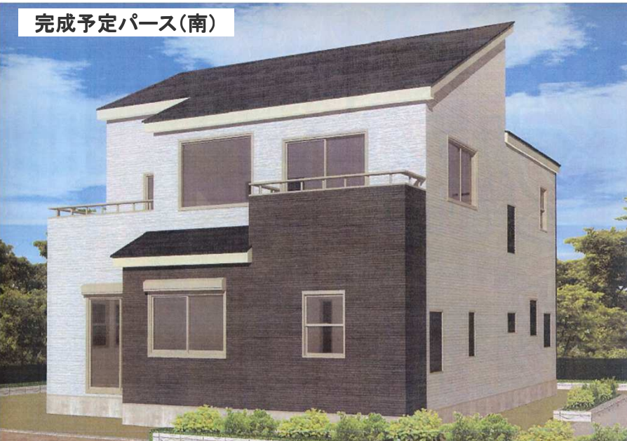
完成予定パース(南)